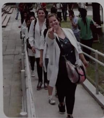
La escuela es uno de los principales espacios en los que nos educamos.

recho social : la facultad de todos y cada uno de recibir educación como forma de desarrollo individual y, al mismo tiempo, de contribuir a mejorar las condiciones de vida en sociedad.