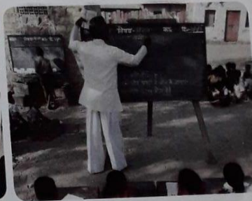
Escuela de pueblo en 1848 (pintura de Albert Anker), escuela rural en una aldea de Camerún y clase en una escuela de la India.

En base a los textos leídos, responder las siguientes preguntas