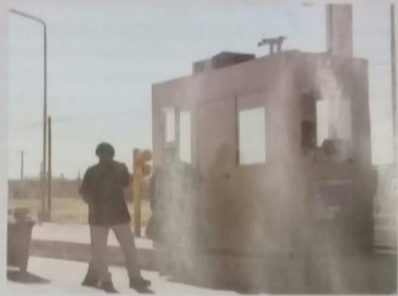
Puesto de peaje en La Banda, Santiago del Estero. Durante la década de 1990, el Estado argentino entregó en concesión gran cantidad de rutas nacionales a empresas privadas.

A diferencia del liberalismo, el neoliberalismo sostiene que no hay funciones que el Estado pueda hacer mejor que el mercado. En consecuencia, el Estado debe limitarse a proveer aquellos bienes y servicios destinados a cubrir necesidades de la comunidad como conjunto. Es el caso de la defensa de la soberanía del Estado que cumplen las fuerzas armadas. También se acepta que brinde algún tipo de asistencia básica (salud, educación, alimentos) a sectores muy marginados con el fin de evitar el estallido de conflictos sociales graves.